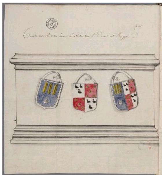
Armas no túmulo de Martim Leme na Catedral de São Donaciano em Bruges, segundo o manuscrito De Hooghe , pertencente à Biblioteca Pública de Bruges ( Openbare Bibliotheek Brugge )