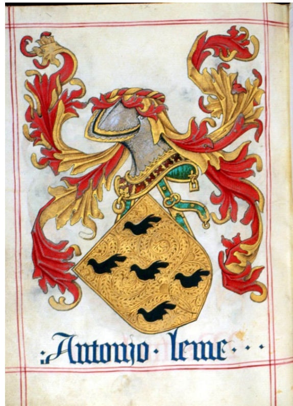
ANTT – Livro do armeiro-mor , fl. 110v Armas de António Leme