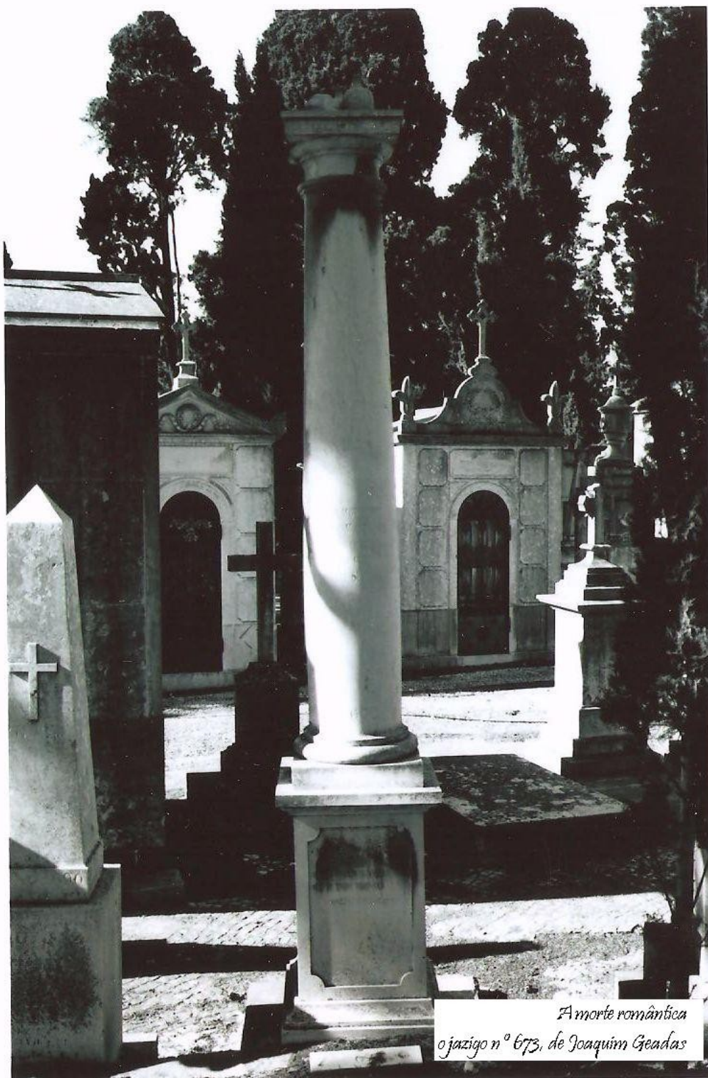
Amorte romântica o jazigo n.º 673, de Joaquim Geadas